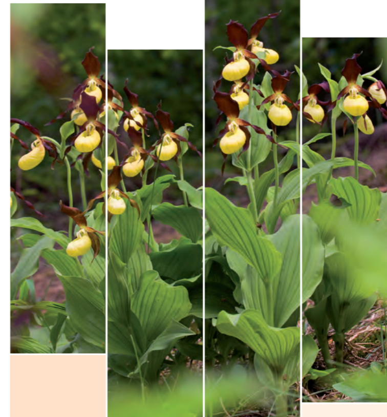
Kalkgeprägte Trockenlebensräume im Kulturland Kreis Höxter